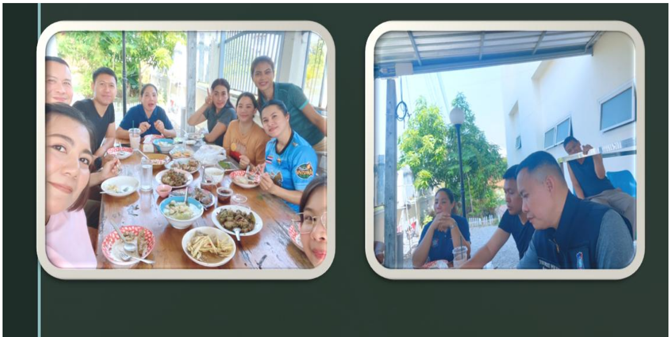
ส.ทท.๒ กก.๑ บก.ทท.๓ ได้จัดสวัสดิการโครงการอาหารให้เป็นประจำทุกวัน