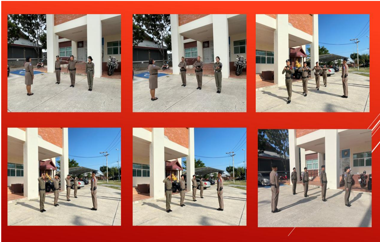
ส.ทท.๒ กก.๑ บก.ทท.๓ ได้มีการฝึกยุทธวิธีประจำสัปดาห์ของเดือน พ.ย.๖๖ ให้กับข้าราชการตำรวจในสังกัด